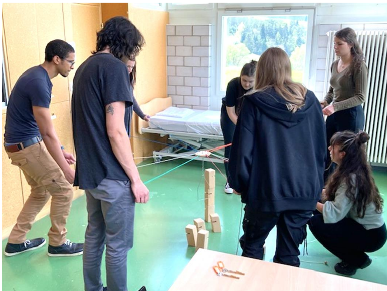
Pratique d'un jeu collaboratif visant à renforcer le travail d'équipe et les compétences en communication.